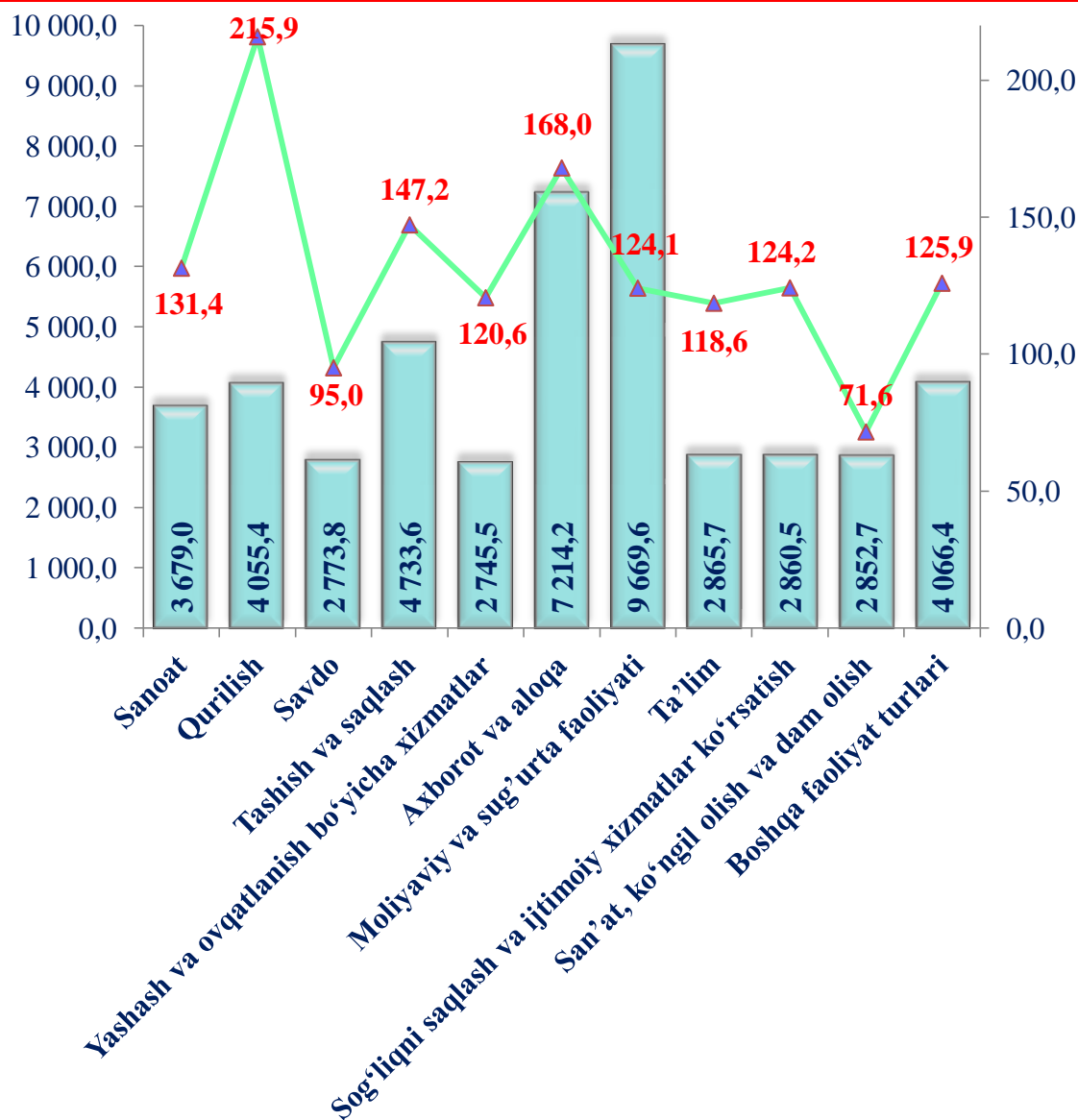
■ Ish haqi miqdori ming so'm ▲ O'tgan yilga nisbatan o'sish sur'ati % da

O'rtacha oylik nominal hisoblangan ish haqi ko'rsatkichini faoliyat turlari bo'yicha ko'radigan bo'lsak, o'rtacha oylik ish haqining o'tgan yilning mos davriga nisbatan yuqori o'sish sur'ati Qurilish sohasida (215,9 %), Axborot va aloqa faoliyati (168,0 %), Tashish va saqlash sohasida (147,2 %), Sanoat sohasida (131,4 %), Sog'liqni saqlash va ijtimoiy xizmatlar ko'rsatish (124,2 %) va Moliya va sug'urta faoliyati (124,1 %) ni tashkil etib, boshqa faoliyat turlariga nisbatan yuqori bo'lmoqda.