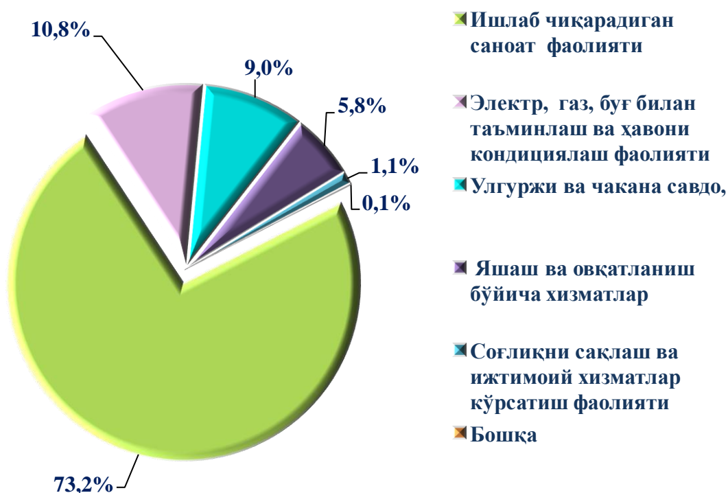
2020 йилнинг январь-ноябрь ойларида зарар кўрган йирик корхона ва ташкилотларнинг иқтисодий фаолият турлари бўйича молиявий натижалари (жамига нисбатан фоизда)

Иқтисодий фаолият турлари бўйича таҳлилий маълумотлар шуни кўрсатмоқдаки, йирик корхона ва ташкилотларда кўрилган зарарнинг асосий қисмини: ишлаб чиқарадиган саноат фаолиятидаги корхоналарда 6 431,8 млн. сўм (жами зарарнинг 73,2 %) ни, электр, газ, буғ билан таъминлаш ва ҳавони кондициялаш фаолиятини кўрсатувчиларда 950,5 млн. сўм (жами зарарнинг 10,8 %) ни, улгуржи ва чакана савдо, моторли транспорт воситалари ва мотоциклларни таъмирлаш фаолиятини кўрсатувчиларда 790,9 млн. сўм (жами зарарнинг 9,0 %) ни, яшаш ва овқатланиш бўйича хизматларини кўрсатувчиларда 508,2 млн. сўм (жами зарарнинг 5,8 %) ни ва соғлиқни сақлаш ва ижтимоий хизматлар кўрсатиш фаолиятидаги корхоналарда 98,1 млн. сўм (жами зарарнинг 1,1 %) ни ва бошқа соҳаларда 10,3 млн. сўм (жами зарарнинг 0,1 %) ни ташкил этмоқда.