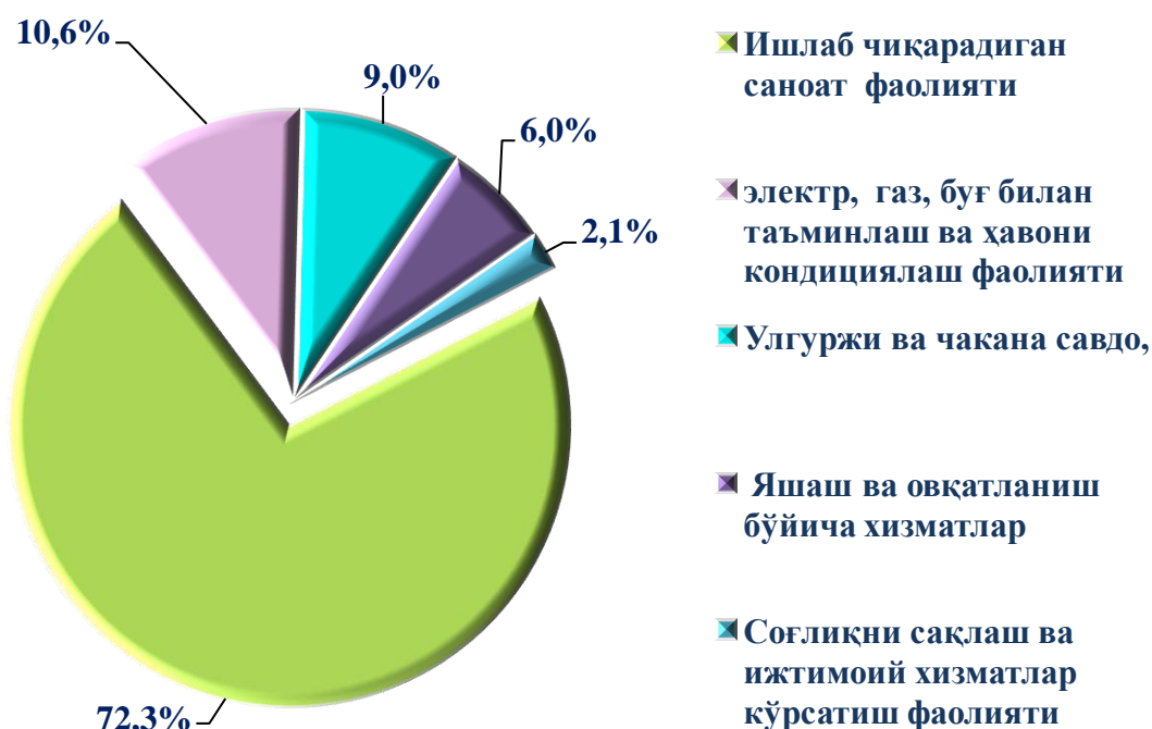
2020 йилнинг январь-август ойларида зарар кўрган йирик корхона ва ташкилотларнинг иқтисодий фаолият турлари бўйича молиявий натижалари (жамига нисбатан фоизда)

Иқтисодий фаолият турлари бўйича таҳлилий маълумотлар шуни кўрсатмоқдаки, йирик корхона ва ташкилотларда кўрилган зарарнинг асосий қисмини: ишлаб чиқарадиган саноат фаолиятидаги корхоналарда 4 348,2 млн. сўм (жами зарарнинг 72,3 %)ни, электр, газ, буғ билан таъминлаш ва ҳавони кондициялаш фаолиятини кўрсатувчиларда 638,6 млн. сўм (жами зарарнинг 10,6 %)ни, улгуржи ва чакана савдо, моторли транспорт воситалари ва мотоциклларни таъмирлаш фаолиятини кўрсатувчиларда 542,1 млн. сўм (жами зарарнинг 9,0 %)ни, яшаш ва овқатланиш бўйича хизматларини кўрсатувчиларда 355,1 млн. сўм (жами зарарнинг 6,0 %)ни ва соғлиқни сақлаш ва ижтимоий хизматлар кўрсатиш фаолиятидаги корхоналарда 127,3 млн. сўм (жами зарарнинг 2,1 %)ни ташкил этмоқда.