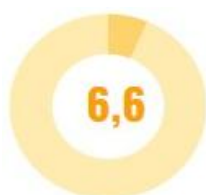
Савдо, яшаш ва овқатланиш бўйича хизматлар