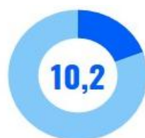
Хизмат кўрсатувчи бошқа тармоқлар