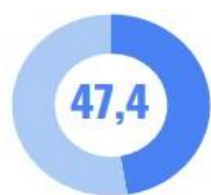
Қишлоқ, ўрмон ва балиқ хўжалиги