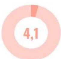
Ташиш ва саклаш, ахборот ва алоқа