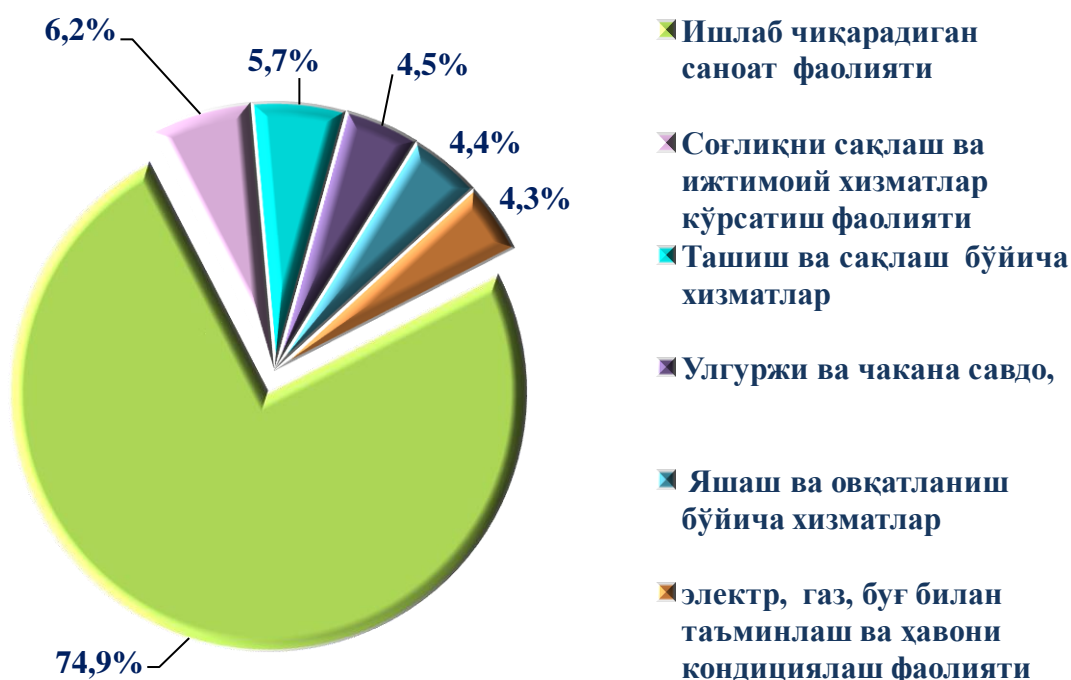
2020 йилнинг январь-май ойларида зарар кўрган йирик корхона ва ташкилотларнинг иқтисодий фаолият турлари бўйича молиявий натижалари (жамига нисбатан фоизда)

Иқтисодий фаолият турлари бўйича таҳлилий маълумотлар шуни кўрсатмоқдаки, йирик корхона ва ташкилотларда кўрилган зарарнинг асосий қисмини: ишлаб чиқарадиган саноат фаолиятидаги корхоналарда 5 544,6 млн. сўм (жами зарарнинг 74,9 фоиз)ни, соғлиқни сақлаш ва ижтимоий хизматлар кўрсатиш фаолиятидаги корхоналарда 459,8 млн. сўм (жами зарарнинг 6,2 фоиз)ни, ташиш ва сақлаш бўйича хизматлар кўрсатувчиларда 425,3 млн. сўм (жами зарарнинг 5,7 фоиз)ни, улгуржи ва чакана савдо, моторли транспорт воситалари ва мотоциклларни таъмирлаш фаолиятини кўрсатувчиларда 336,2 млн. сўм (жами зарарнинг 4,5 фоиз)ни, яшаш ва овқатланиш бўйича хизматларини кўрсатувчиларда 324,8 млн. сўм (жами зарарнинг 4,4 фоиз)ни, электр, газ, буғ билан таъминлаш ва ҳавони кондициялаш фаолиятини кўрсатувчиларда 316,8 млн. сўм (жами зарарнинг 4,3 фоиз)ни ташкил этмоқда.